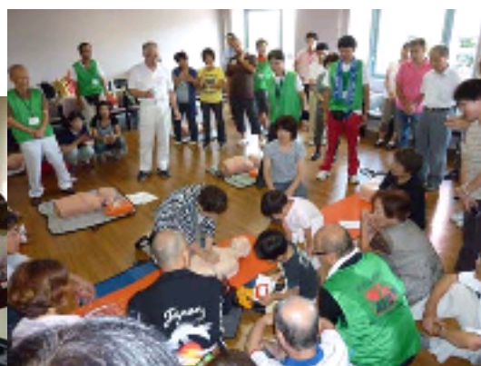
91 歳と 4 歳の命のリレー