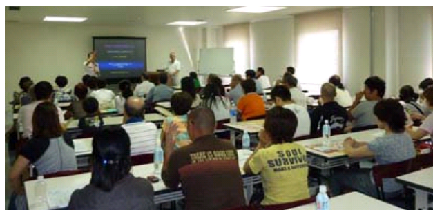
講演「あなたは愛する人を救えますか」